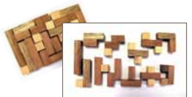
12のパーツで世界が広がる！