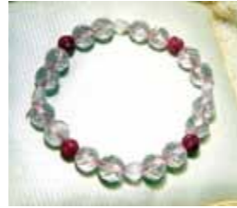
こんなブレスレットが作れます

受講料無料！ *材料費などをいただく講座もあります。 チラシの内容をご確認ください。