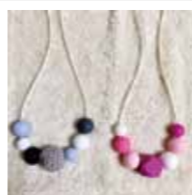
歯固めネックレス