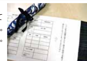
巻物エンディングノート