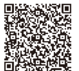
センター Face Book