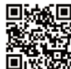
センターホームページ