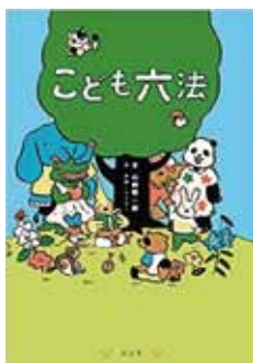
山崎 聡一郎 著 弘文堂 (2019年8月刊)

法律はみんなのためのルールなのに、みんなが読めるように書かれていません。本書はそんな法律を誰でも読める形にしようと試みたものです。